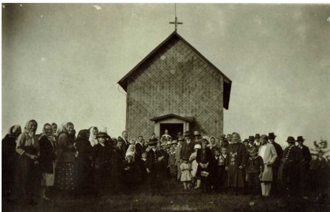
Anna Kapelle auf dem Ernestinenberg in Bärnwald

Die Kapelle musste 1936 dem Bunkerbau weichen. Sie wurde in Ottendorf wieder aufgebaut!