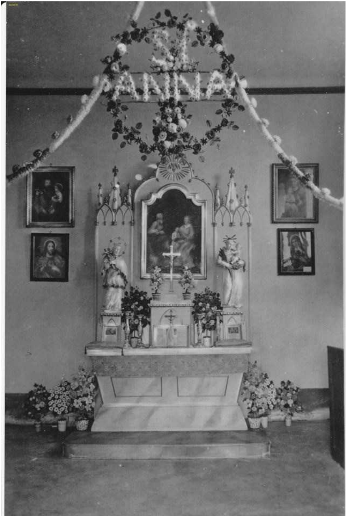
Altar der Anna Kapelle