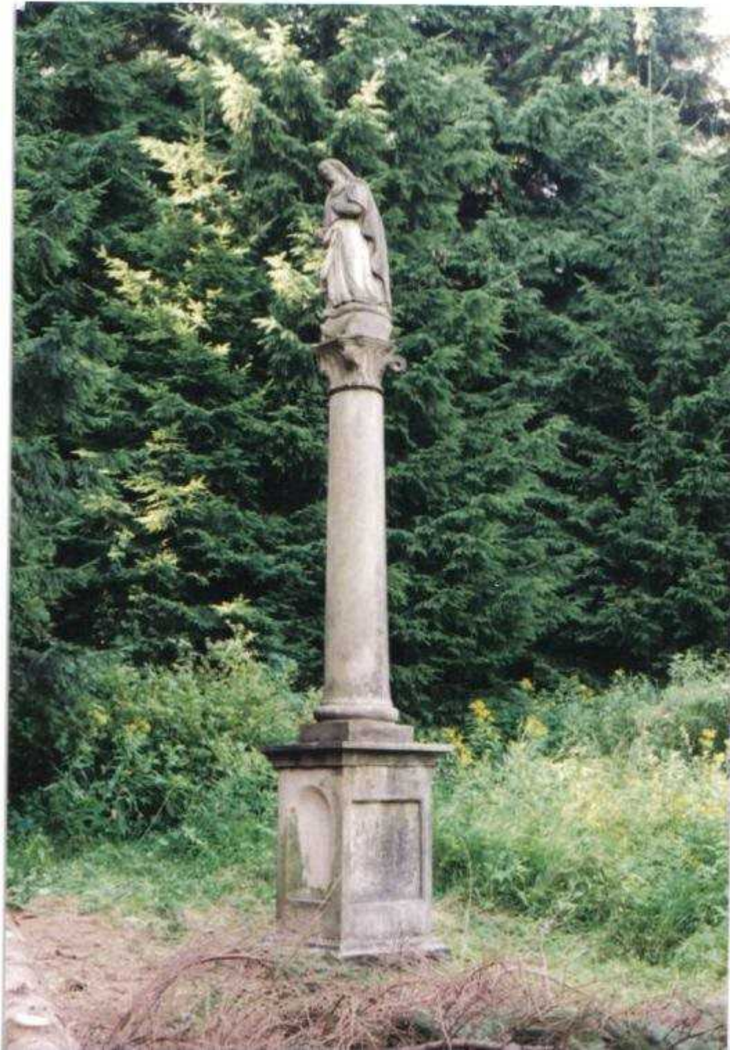
Standfigur Heilige Otilie, steht nach dem Abbau der Kapelle nach 1936 Im Oberdorf in Bärnwald, am ehemaligen Bauernhaus der Familie Tasler